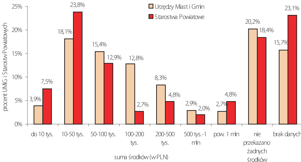
Wykres 1. SKALA WSPARCIA ORGANIZACJI - środki finansowe przekazane przez Urzędy Miast i Gmin oraz Starostwa Powiatowe w 2005 roku